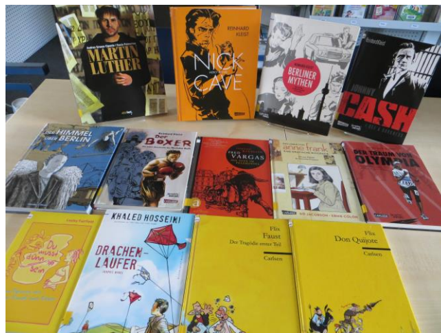
Neue Medien: Graphic Novel

werden hier anschaulich gut aufbereitet und modern erzählt. Schauen Sie mal rein - es lohnt sich!