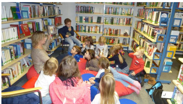
Vorlesestunde am 18. Dezember 2017

Jeden letzten Montag im Monat zwischen 17.00 und 18.00 Uhr